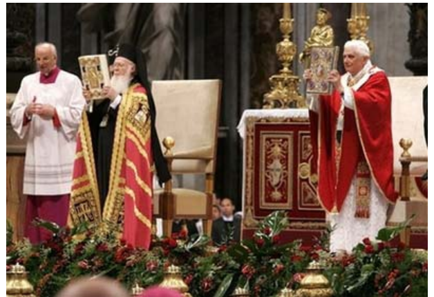
El Papa Benedicto XVI y el Patriarca Ortodoxo celebraron juntos algunas partes de la Misa en la solemnidad de San Pedro y San Pablo.