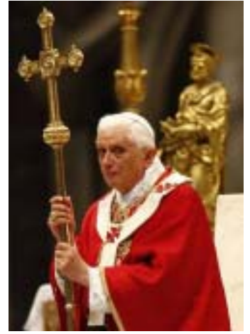
Tras la misa solemne de la festividad de San Pedro y San Pablo, el Papa rezó el Ángelus en la Basílica Vaticana.