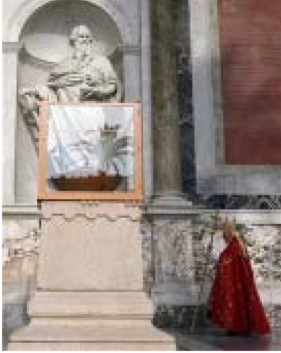
Los restos de San Pablo fueron expuestos por primera vez al público.