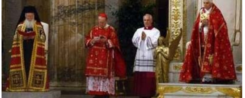
El Papa Benedicto XVI rezó las primeras vísperas en la Basílica de San Pablo Extramuros