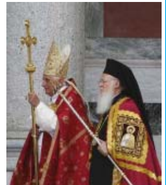
El Papa hizo un fuerte llamado a la unidad de los cristianos.