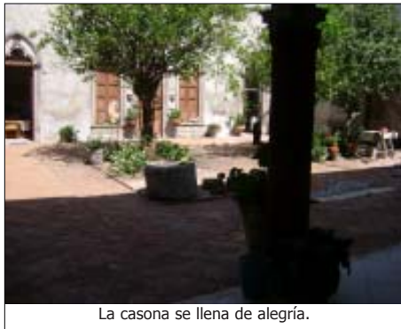
La casona se llena de alegría.

Fueron cuatro puntos claves: El día de irse al Seminario, 23 de octubre de 1961. Un año el Río Lagos rompió la carretera Panamericana, porque se iniciaba en Lagos, en la casa nueva de La Cruz de Los Chirlitos, en des poblado. Cd. Guzmán en el sur al pie del volcán, Totatiche en el norte con su gris lejanía y su legado de historia, Guadalajara levantando el vuelo, blandita aún la obra de González Gallo; San Juan del gran templo y la hermosa Virgen,