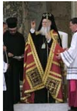
El Patriarca Ortodoxo, Bartolomeo I, participó también durante toda la ceremonia de apertura y al final impartió la bendición.