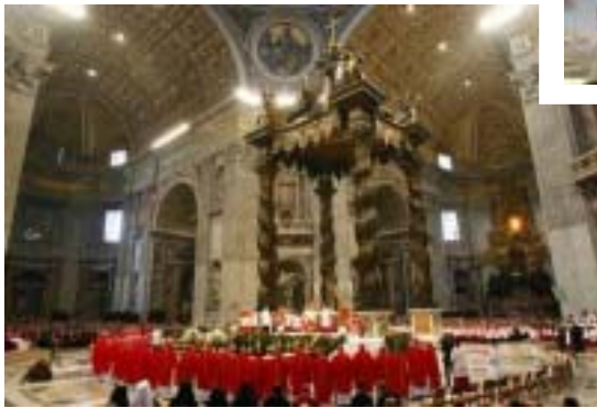
Concelebraron con el Santo Padre los 40 nuevos arzobispos metropolitanos, a quienes Benedicto XVI impuso el palio arzobispal.