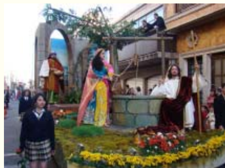
La samaritana, signo de conversión.