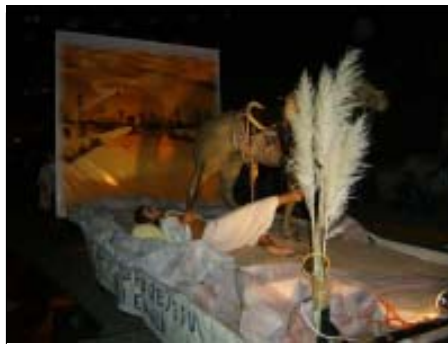
Conversión de Saulo.

Es, pues, por eso que toda la fiesta guadalupana estuvo centrada en estos dos as-