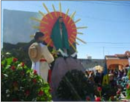
María de Guadalupe.

Con gran júbilo y alegría hemos vivido nuevamente la fiesta a nuestra señora de Guadalupe en santa María del Valle. Este pueblo guadalupano se ha vestido de fiesta porque le tiene amor a María, la Madre de Dios, y porque a la vez es Madre nuestra. Como tenía que faltar la expresión de amor a nuestra Madre. A un hijo jamás se le debe y puede olvidar el amor que una madre le brinda a sus hijos. María de Guadalupe nos ha mostrado todo su amor, nos ha mostrado que somos sus hijos, que nos cuida, que nunca nos abandona; somos hijos guadalupanos. Es por este motivo que festejamos a la madre que está siempre con nosotros.