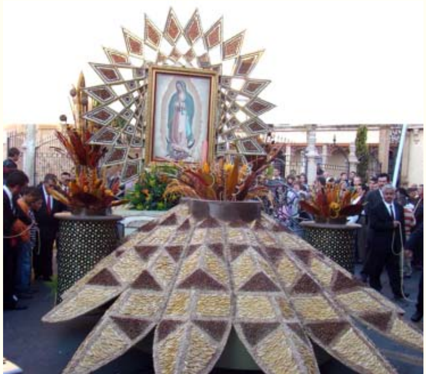
Bendita entre las mujeres.