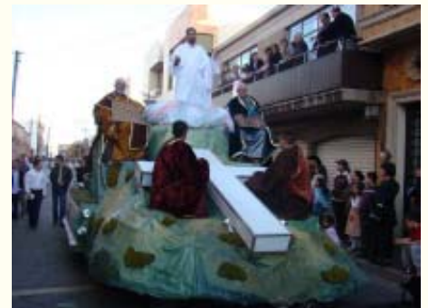
Jesús se transfigura.