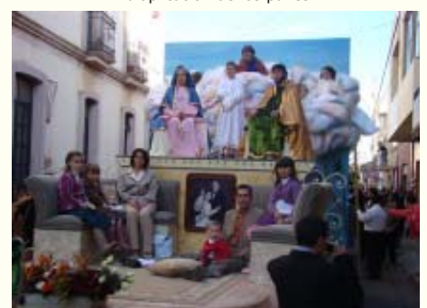
Modelo de esperanza, la sagrada familia.