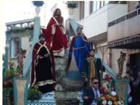
Apostoles primeros misioneros.