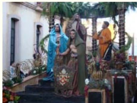
Cristo entrega las llaves.