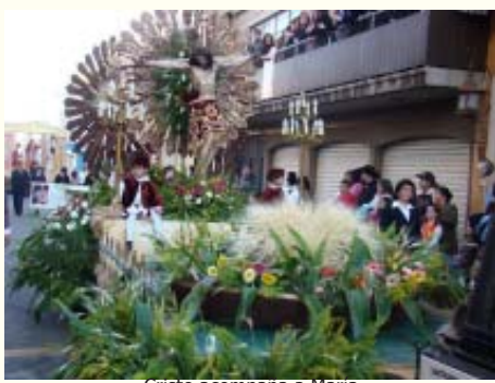
Cristo acompaña a María.