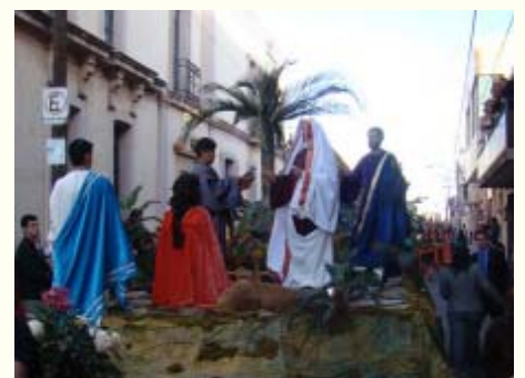
Multipliación de los panes.