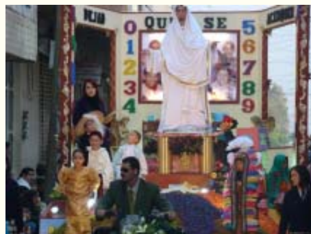
Jesús y los niños.