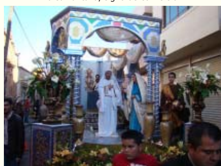
Primer milagro de Jesús.