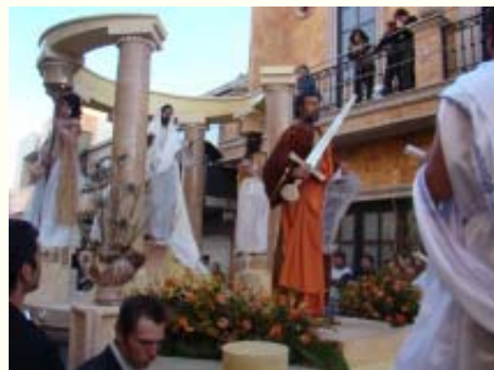
El apostol de los Gentiles.