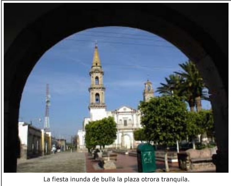
La fiesta inunda de bulla la plaza otrora tranquila.

La fiesta patronal se hace circunstancia y motivo. En torno a la fiesta se urde la vida del pueblo. La fiesta es la experiencia dominante. Es la fiesta la que dimensiona la vida de las familias, que marca la vida de los niños con un sello característico y único.