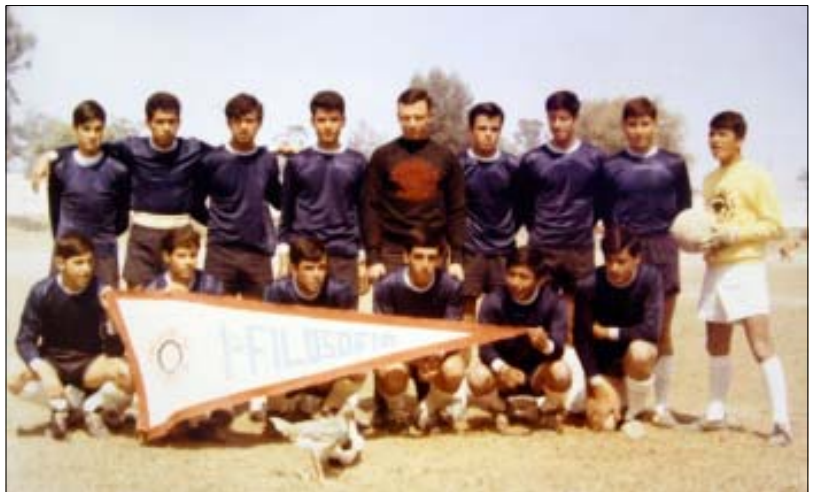
Fomentando el deporte en el Seminario Mayor