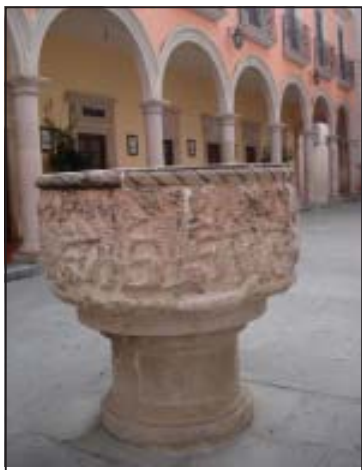
Lugar en que recibió el Bautismo