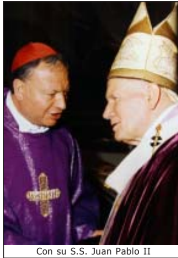
Con su S.S. Juan Pablo II