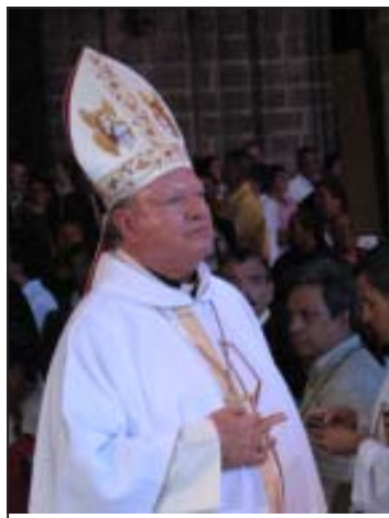
En la toma de posesión de Mons. Navarro