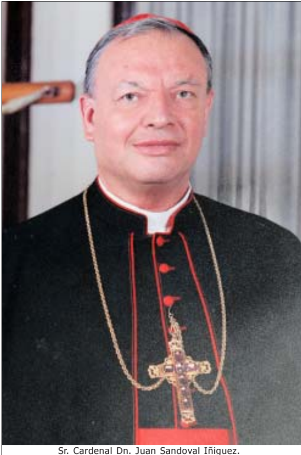
Sr. Cardenal Dn. Juan Sandoval Iñiguez.