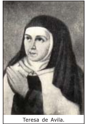
Teresa de Avila.

Los carmelitas descalzos, en cambio, llegaron en 1585 y se instalaron en San Sebastián, Atzacualco, Puebla, Atlixco, Morelia, Guadalajara y Celaya; con estos monasterios se constituyó la Provincia de San Alberto de Indias en 1595, con su noviciado en San Ángel; con el paso del tiempo se instalaron también en Querétaro, Salvatierra, Tacuba, Toluca, Oaxaca, San Luis Potosí, Tehuacan y otros sitios hasta alcanzar una veintena al final de la Colonia. Nueva España fue el único lugar de América donde estuvieron estos carmelitas.