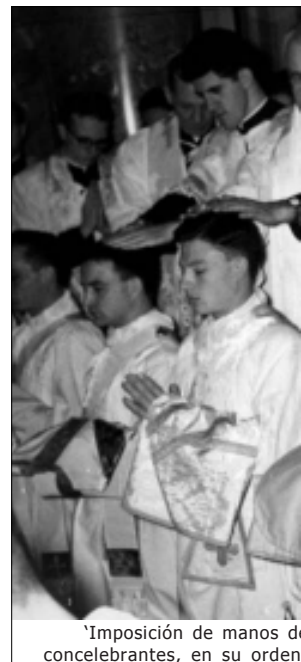
'Imposición de manos d concelebrantes, en su orden