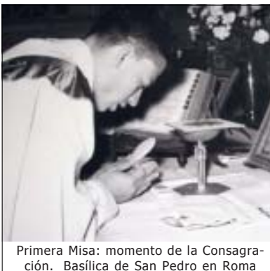
Primera Misa: momento de la Consagración. Basílica de San Pedro en Roma