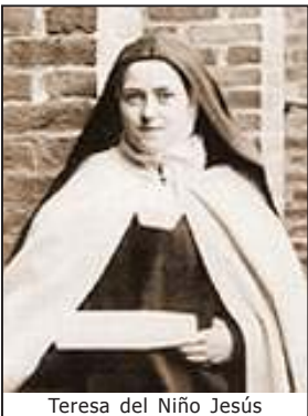
Teresa del Niño Jesús

En los años sucesivos la orden fue relajando la disciplina; muchos de sus miembros recibían herencias familiares o ingresos por sus trabajos y predicaciones; además, es bien conocido que si una autoridad se prolonga en un cargo, por ley natural pierde el impulso con los años. Además, la escasez de clero que dejó la peste negra de 1348 hizo que muchos carmelitas asumieran cargos eclesiásticos, o incluso fungieran como capellanes de embarcaciones o cantores de iglesias. Esto motivó diversos intentos de reforma: en los conventos italianos (1413), durante el generalato de Juan Joreth (1451-1471) y de la congregación de Albi en Francia.