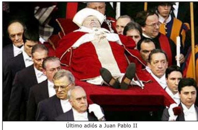
Último adiós a Juan Pablo II

Las exequias cristianas son una celebración litúrgica de la Iglesia. El ministerio de la Iglesia pretende ex-