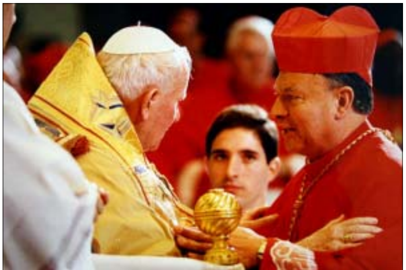
'Nombrado CArdenal en noviembre de 1994 por su S.S. Juan Pablo II.'