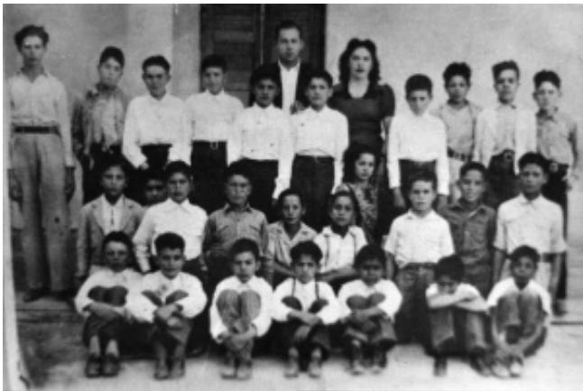
Compañeros de la Escuela Primaria (sentado abajo a la izquierda)