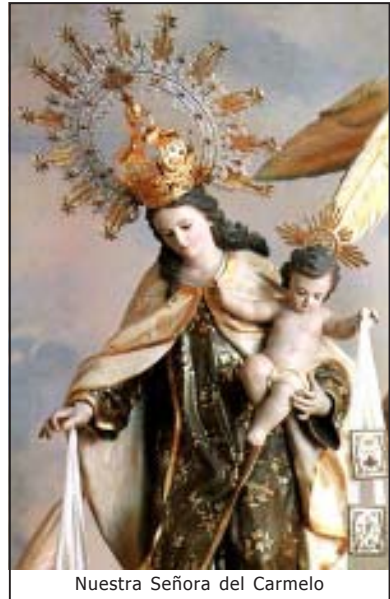
Nuestra Señora del Carmelo

gen se remonta a 1156, cuando algunos cruzados y peregrinos se instalaron en el lugar donde el profeta Elías actuó contra los profetas de Baal, según cuenta el primer libro de los Reyes; el Monte Karmel (voz que significa huerto o «jardín»), al sur de Haifa (Palestina) fue por décadas la casa de estos semi eremitas dedicados a la oración, la penitencia y el trabajo. Alberto de Vercelli, el patriarca latino de Jerusalén que residía en San Juan de Acre, les dio una regla de vida hacia 1210, inspirándose en la regla de san Agustín. Los carmelitas palestinos debían pro-