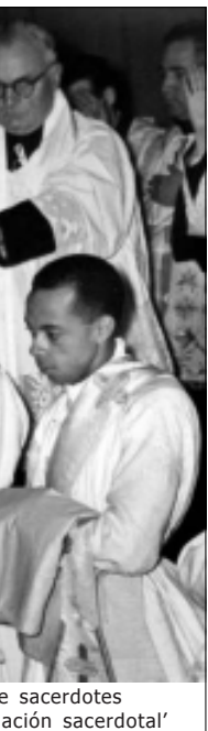
de sacerdotes ación sacerdotal'