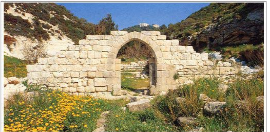
Restos del primer monasterio carmelita en el Monte Carmelo.

va orden se le llamó «Carmelitas Descalzos» o «Teresianos», y a la antigua se le siguió conociendo como «Carmelitas de la Antigua Observancia» o «Calzados».