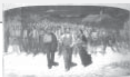
Vocalía de difusión de la Doctrina Social de la Iglesia

Invitación a la Doctrina Social de la Iglesia