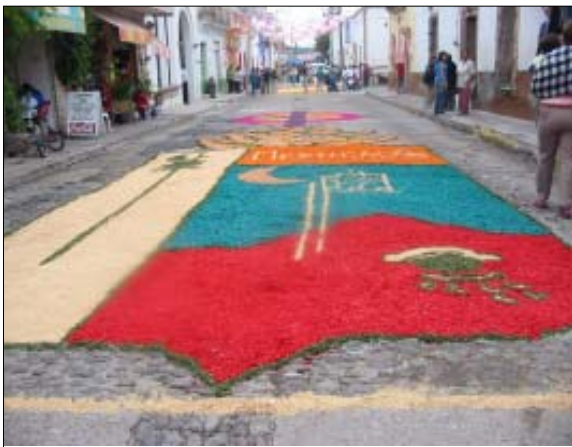
Desde muy temprano los tapetes de flores ya espesaban el ingreso del Sagrado Corazón de Jesús.