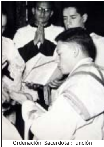
Ordenación Sacerdotal: unción

Y ahora, el pueblo que lo vio nacer, se prepara para celebrar el 50 aniversario de su ordenación sacerdotal, que será Dios mediante el próximo jueves 20 de septiembre de 2007 en la parroquia de San Miguel Arcángel de Yahualica y a la cual todos están cordialmente invitados.