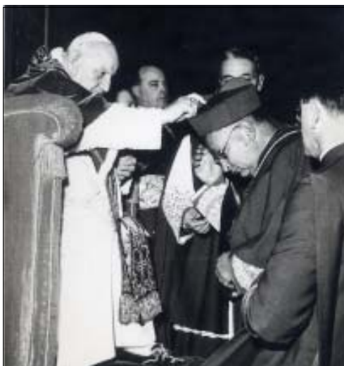
El Papa Juan XXIII entregando el capelo cardenalicio al Sr. Cardenal Don José Garibi Rivera

• Acerca de la propiedad hace notar que el tema se plantea en el siglo XX de forma diferente a cómo se planteó antes: ya no tiene fuerza el argumento de futuro para justificarla, pues la mayoría de los hombres aseguran su futuro de otra forma. Otros factores — el poder de decisión — y otros valores económicos tienen más importancia que la mera propiedad.