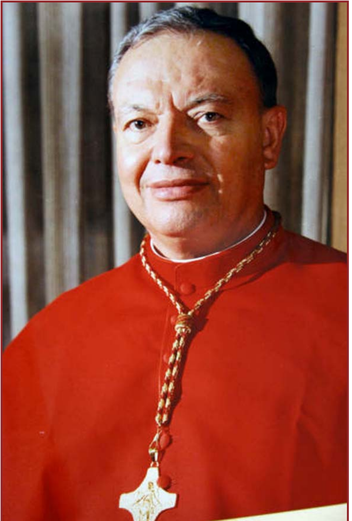
El Emmo. Sr. Cardenal Dr. Dn. Juan Sandoval Íñiguez, celebra sus 50 años de sacerdocio, el 20 de septiembre de 2007, en Yahualica, Jal.