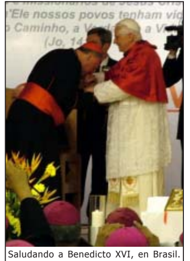
Salutando a Benedicto XVI, en Brasil.