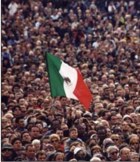
+ Felipe Arizmendi Esquivel Obispo de San Cristóbal de las Casas