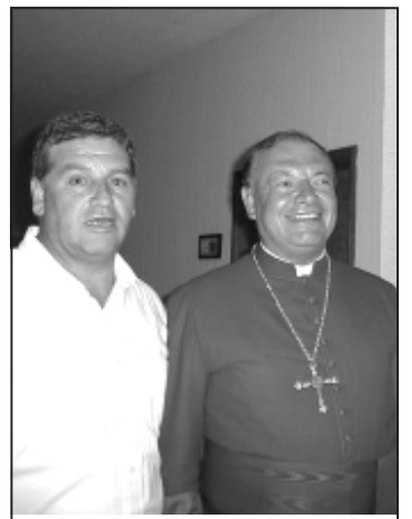
Con los amigos sacerdotes