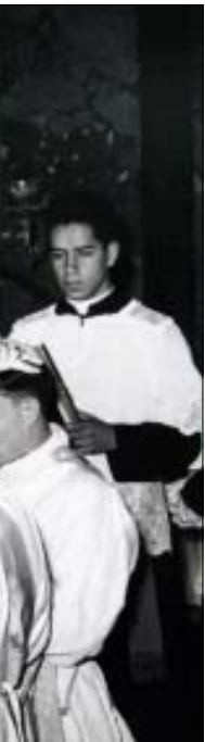
Italia, 1957; Arzobispo.