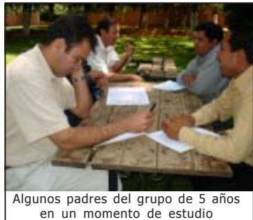
Algunos padres del grupo de 5 años en un momento de estudio