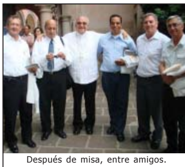
Después de misa, entre amigos.

Dios es quien elige desde toda la eternidad, desde antes de existir Dios nos llama por amor, desde el vientre materno dice San Pablo. Los designios de Dios no cambian. Antes de nacer, cuando no existíamos sino en la mente de Dios el nos llama. Por eso el Papa