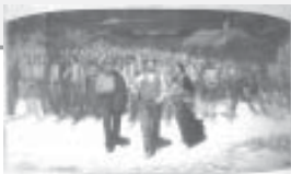
Vocalía de difusión de la Doctrina Social de la Iglesia

Invitación a la Doctrina Social de la Iglesia