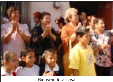
Bienvenido a casa

La mañana rica, hermosa, brechas de mirasoles colmando los potreros, verde intenso en los campos, arbustos trepando por los relices y las barrancas. Allende el Río Verde, que fielmente se abraza a su cauce, Yahualica está de fiesta por los días de San Miguel, como siempre desde 1542 en que Fray Miguel de Bolonia le puso su