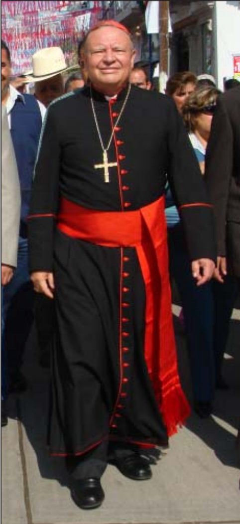
El Señor Cardenal Don Juan Sandoval Iñiguez