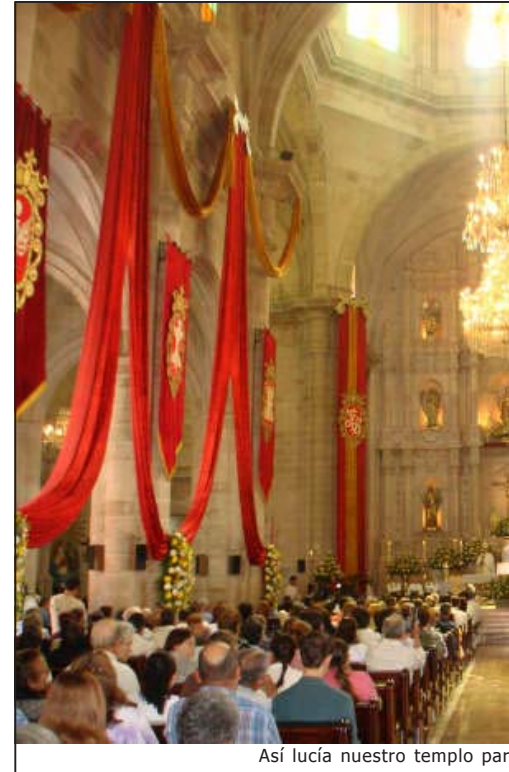
Así lucía nuestro templo par

Después de la elección Dios, de alguna forma, da a conocer su voluntad