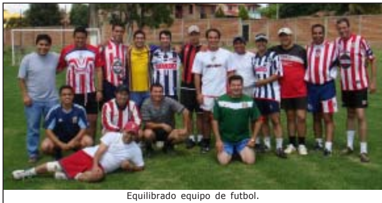
Equilibrado equipo de fútbol.

P. Sergio Abel sergio@mensajerodiocesano.com