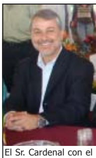
El Sr. Cardenal con el

medios de mi familia cilla y cristiana. Pe- lar, Dios me llamó e estas en honor de S mos en el castillo,