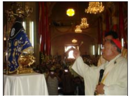
Asperción con agua bendita a la Imagen de la Virgen de San Juan.

Por la noche fuimos testigos de la primera reunión del Congreso del Estado de Jalisco en nuestra tierra, sesionaron públicamente para entregar un reconocimiento al Emmo. Sr. Cardenal por ser un promotor de los valores y la vida en Jalisco. Momentos después la Sinfónica del Estado de Jalisco nos hizo vibrar con sus interpretaciones musicales, las cuales hicieron muy especial el mo-