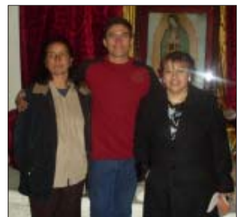
Organizadores de las Fiestas Patronales.

El sábado 11 de Diciembre ya en vísperas a la gran Fiesta nos deleitábamos con la danza del Torito,