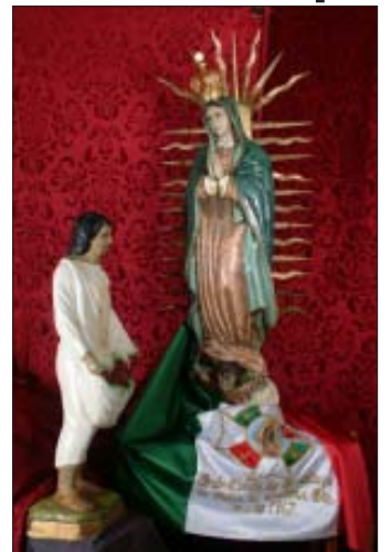
Nuestra Señora de Guadalupe de Jalpa