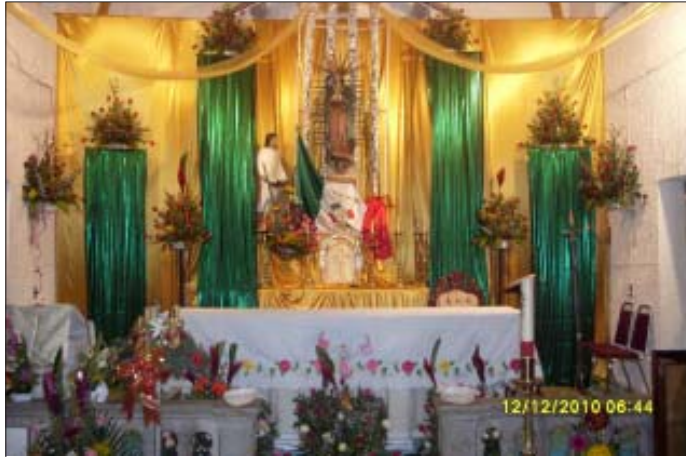
Así lució el altar de Nuestra Señora de Guadalupe de Jalpa.

Muy contentos de celebrar la Fiesta Patronal de nuestro Pueblo participábamos en todo los eventos presentados en el Teatro del Pueblo; así mismo culminaban con