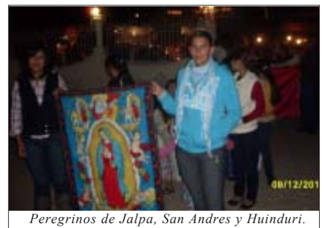
Peregrinos de Jalpa, San Andrés y Huinduri.

Que quienes lean este libro, descubran la presencia de Dios en nuestra historia.