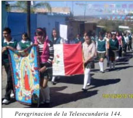
Peregrinación de la Telesecundaria 144.

Por ese motivo el gran día de la Fiesta a Nuestra Señora de Guadalupe de Jalpa, varios