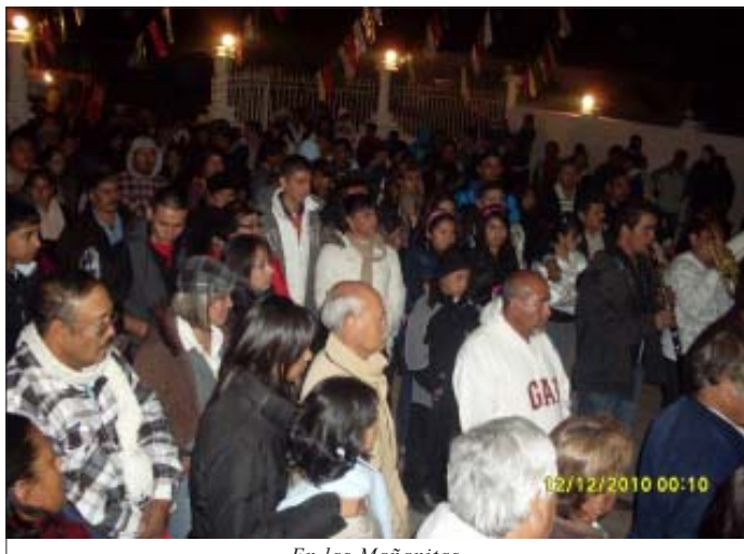
En las Mañanitas.

Por primera vez dentro de la Fiesta Patronal de Guadalupe de Jalpa, la escuela Telesecundaria 144 del Pueblo, también se hizo presente en peregrinación, la Eucaristía fue presidida por el