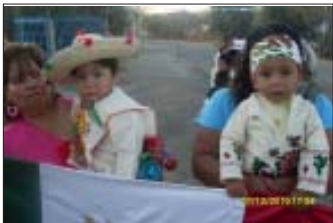
Hasta los mas pequeños se vistieron de Juan Diego.

Posteriormente también daba inicio la Semana Cultural de Guadalupe 2010, en la cual se presentaban diferentes eventos que mostraban lo mejor de nuestro Pueblo.