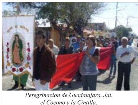
Peregrinación de Guadalajara. Jalisco, el Cócono y la Cintilla.

hombres hicieron el honor de bajar del retablo donde yace siempre, a la bendita imagen para ser colocada en la base en que se apoyarían cuatro hombres para cargarla y darle el recorrido por la calle principal.