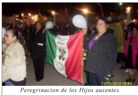
Peregrinación de los Hijos ausentes.

Acompañados por la Danza y la banda de viento, nos encaminamos a la entrada de la comunidad donde aguardaban las personas con globos, confeti y serpentinas para alabar y glorificar a nuestra madre María de Guadalupe, todos juntos encaminamos de regreso a la iglesia a la bendita imagen cantando alabanzas sin faltar el canto de la Guadalupana, mientras se hacía el recorrido se sentía la emoción de las personas que nos acompañaban pues no solo la gente de Guadalupe, si no se hacían presentes la gente de Jalpa, Frías, el Pederal, San Andrés y las Colonias; pudiendo observar en sus expresiones la emoción que sentían de ver de cerca a la virgen, pues la alegría no solo se manifestaba en risas si no en el caer de las lágrimas en algunas personas.