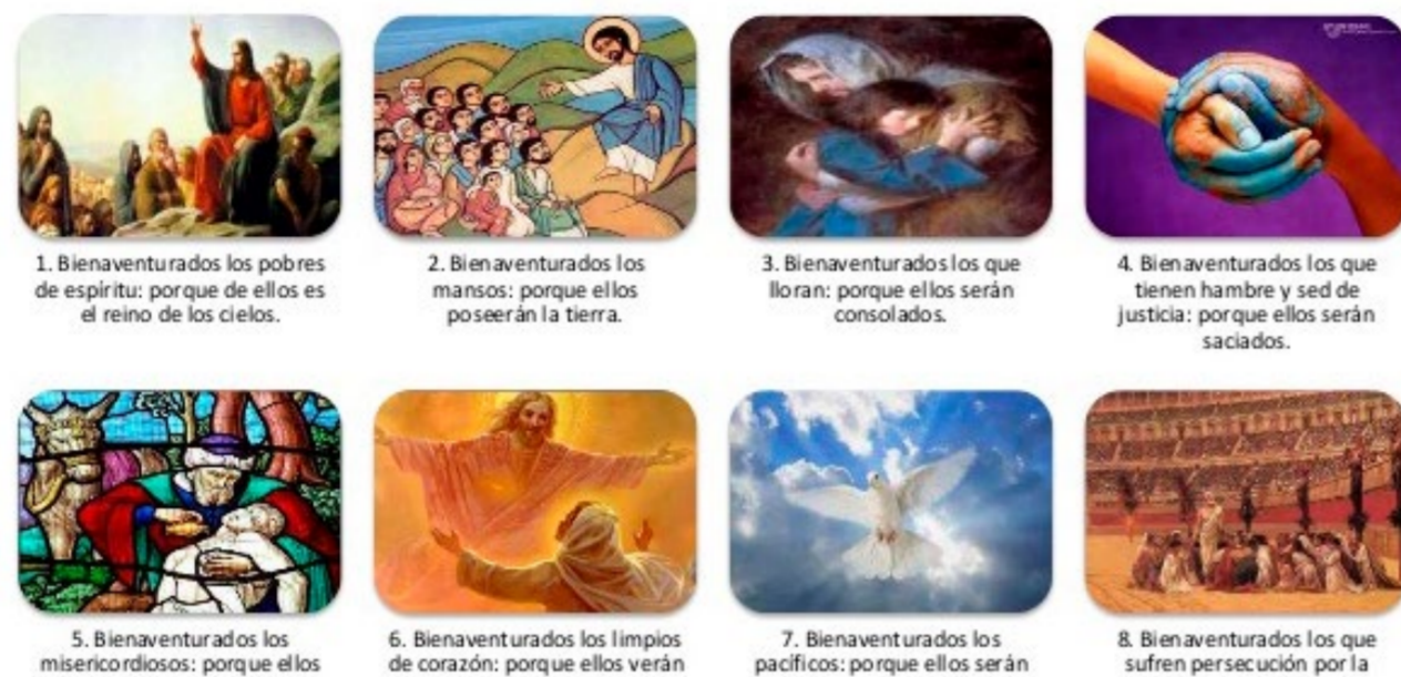
1. Bienaventurados los pobres de espíritu: porque de ellos es el reino de los cielos.

Cada bienaventuranza está compuesta de tres partes. Primero está siempre la palabra "bienaventurados"; luego viene la situación en la que se encuentran los bienaventurados: la pobreza de espíritu, la aflicción, el hambre y la sed de justicia, y así sucesivamente; finalmente está el motivo de la bienaventuranza, introducido por la conjunción "porque": "Bienaventurados sean estos porque, bienaventurados sean aquellos porque...". Así son las ocho bienaventuranzas y