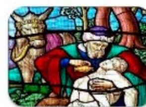
5. Bienaventurados los misericordiosos: porque ellos