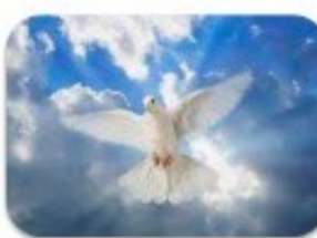
7. Bienaventurados los pacíficos: porque ellos serán