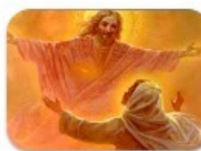
6. Bienaventurados los limpios de corazón: porque ellos verán