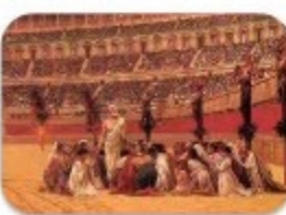
8. Bienaventurados los que sufren persecución por la

estarán bien aprenderlas de memoria para repetir las, para tener en la mente y en el corazón esta ley que Jesús nos dio. Prestemos atención a este hecho: la razón de la dicha no es la situación actual, sino la nueva condición que los bienaventurados reciben como regalo de Dios: "porque de ellos es el reino de los cielos", "porque serán consolados", "porque heredarán la tierra", y así sucesivamente.